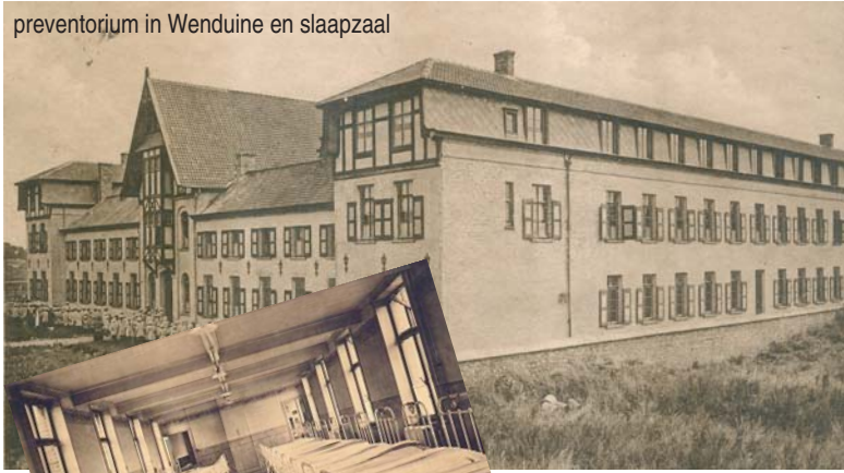
preventorium in Wenduine en slaapzaal