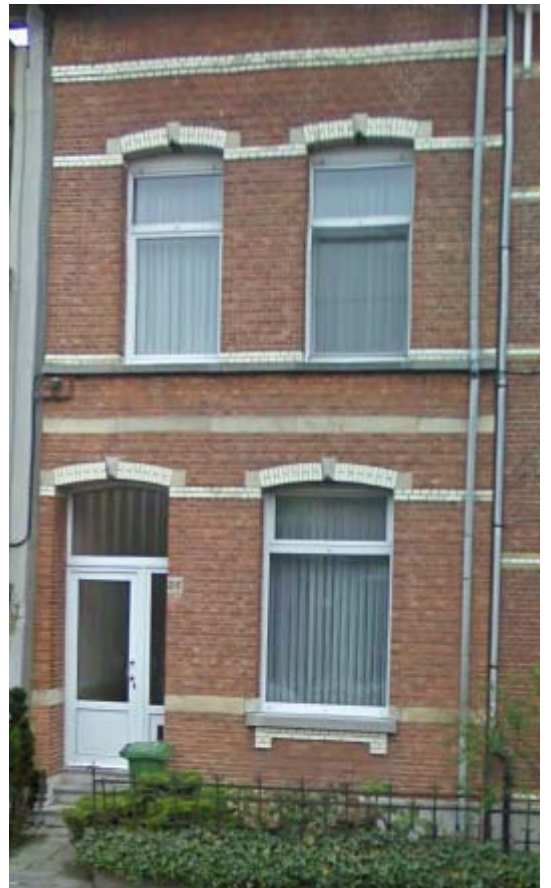
Van Praetlei 37, huidige toestand