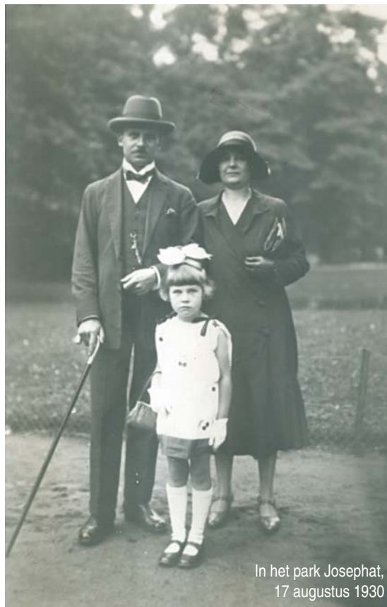
In het park Josephat, 17 augustus 1930

Bij mooi weer gingen we al eens wandelen in het park Josephat. De mode was toen: ma met een hoed en pa met een hoed en wandelstok.