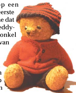
de gebreide kleertjes zijn van vééél latere datum

Ondertussen moest ik al verder weg boodschappen doen, naar een grote winkel, de 'coöperative' noemden ze dat. Op de weg naar huis, liep ik verkeerd en begon te wenen. Ik zag een grote vlakke, allemaal zand, waar kinderen speelden. Een ouder meisje heeft me dan de weg gewezen. Ons ma stond al achter 't venster op de uitkijk.